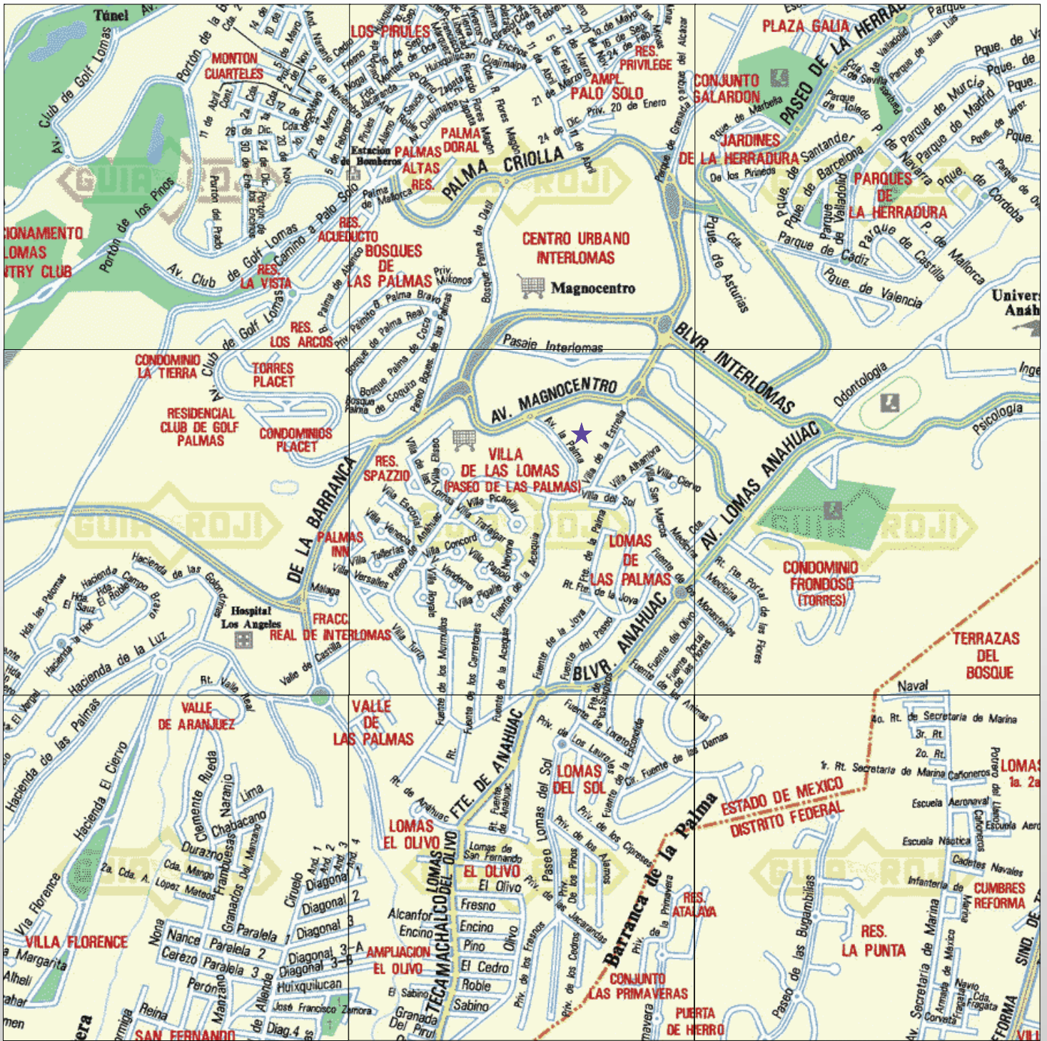
Plano 094 Coordinada 3D (Central)

Derechos Reservados © Guia Roji, S.A. de C.V.